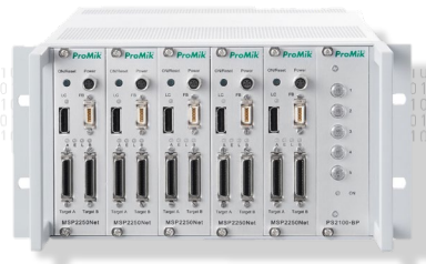
19" 1/2 랙