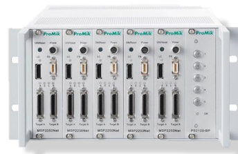
19" 1/2 랙